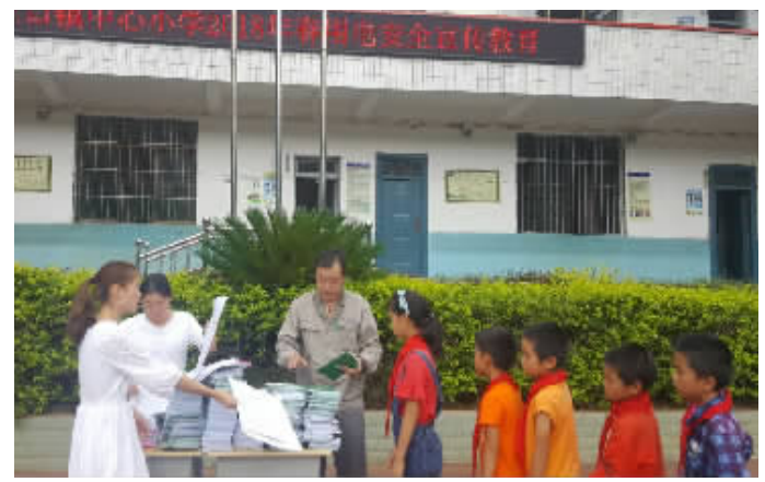
在学校向学生发放安全用电宣传资料