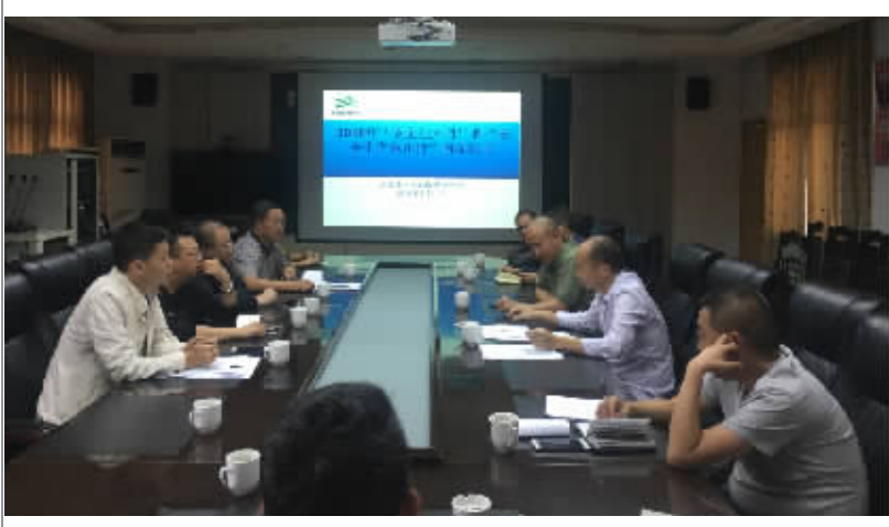
“安全生产月”和“安全生产金州行”启动仪式

通过系列的安全活动,营造安全生产月的安全发展舆论氛围,全面提高社会全员的安全生产素质,保证了安全生产宣传的针对性和实效性。同时,提高员工的安全生产意识,减少安全生产事故的发生,实践“生命至上、安全发展”安全月主题目标,着力构建和谐平安单位。