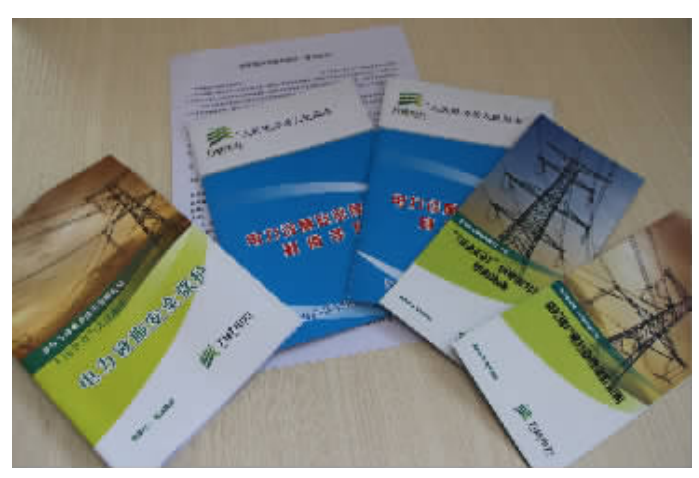
各类安全用电宣传资料