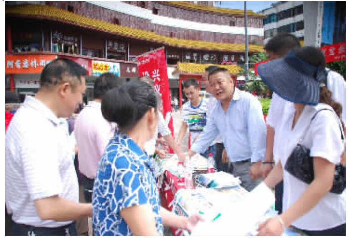
工作人员在向市民讲解安全用电及发放宣传资料