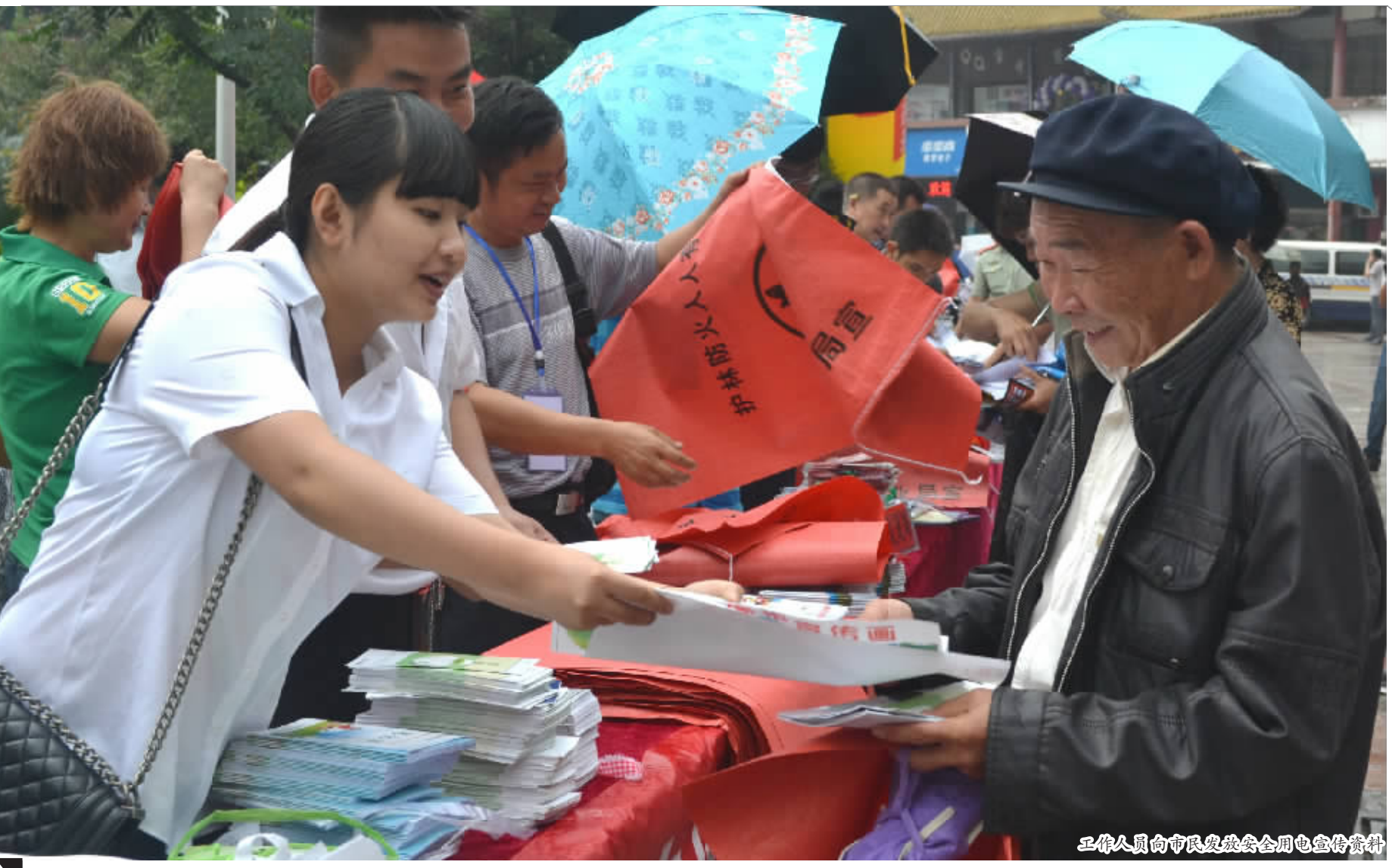
工作人员向市民发放安全用电宣传资料