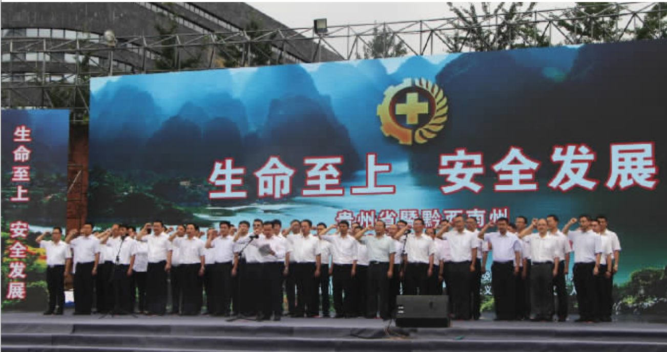
贵州省黔西南州2018年“安全生产月”宣传咨询日活动在兴义市桔山广场启动

贵州万峰电力公司历年对安全高度重视,每年在安全生产资金投入100万元左右,用于配置各类安全生产工具器、标示牌、安全用电宣传用品等,确保安全生产。成立以公司主要负责人为组长的“安全生产月”和“安全生产金州行”活动领导小组,公司安委会办公室及各部门、各子公司在领导小组的指导下,负责具体组织实施相关活动。