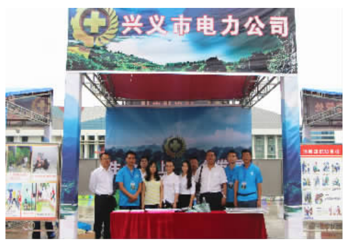
工作人员在宣传活动现场留影

6月12日,贵州省黔西南州2018年“安全生产月”宣传咨询日活动在兴义市桔山广场启动。本次活动以“生命至上、安全发展”为主题,以增强全民应急意识、提升公众安全素质、提高防灾减灾救灾能力、遏制较大及以上安全事故、提升应急管理为目标,以强化安全红线意识、落实安全责任、推进依法治理、深化专项整治、深化改革创新等为重点内容,开展政治性、专业性、文艺性、新闻性有机结合、富有实效的宣传教育活动,进一步推动安全文化“七进”活动,弘扬新时代贵州精神,加强安全法治,普及安全知识,提升全民安全素质,坚决遏制各类生产安全事故的发生,着力提升全社会整体安全水平,促进贵州万峰电力公司安全生产形势持续稳定。