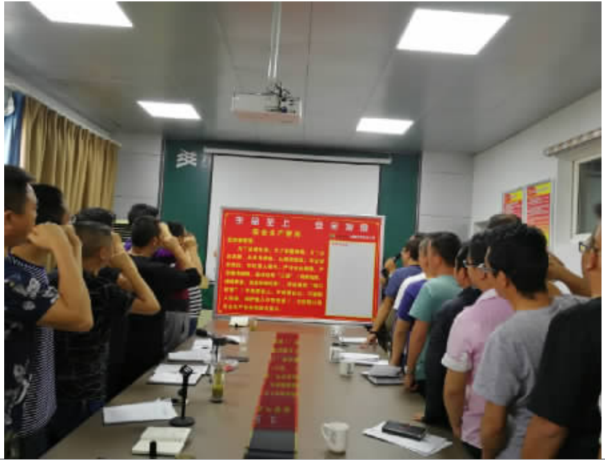
安全生产宣誓仪式