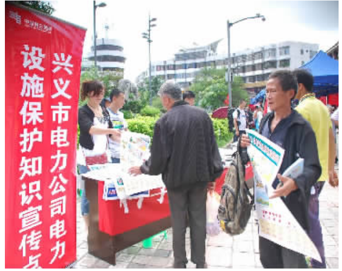
市民在宣传点了解电力设施保护及安全用电知识