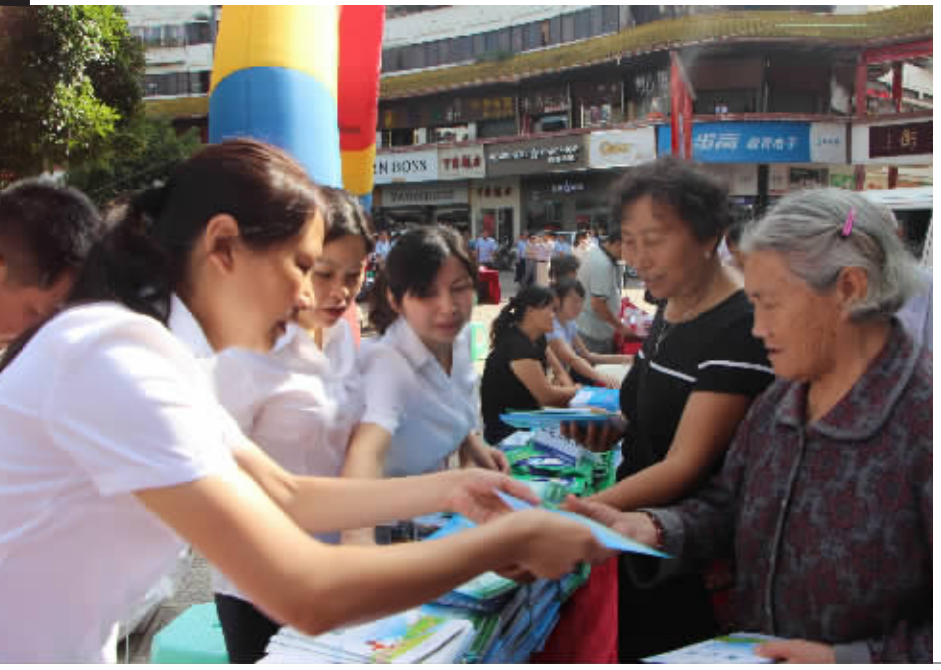
工作人员向市民发放安全用电宣传资料