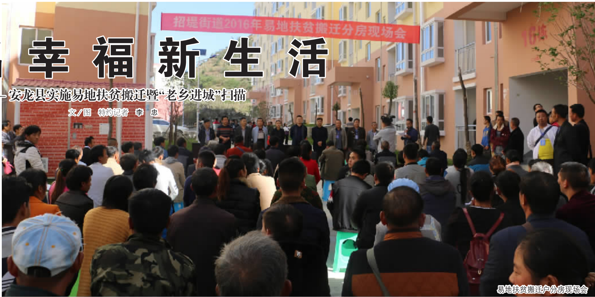
易地扶贫搬迁户分房现场会

核心提示: 安龙县总人口47.47万人,贫困人口5.3万人,其中85%以上集中分布在信息闭塞、生态环境脆弱、自然灾害频繁、一方水土养不活一方人的深山区、石山区、边远山区和少数民族聚居区。为打赢脱贫攻坚这场硬仗,县委、县政府在全面贯彻落实好省、州易地扶贫搬迁政策的同时,积极探索,着眼于“让更多群众过上甜日子”,大力实施“老乡进城”工程,将居住在深山区、石山区、边远山区或其他交通不便地区的自愿搬迁户搬入城市,明确用3年时间搬迁5万人,5年时间搬迁10万人,最大限度释放搬迁红利,实现乡村发展倍增和城市发展倍增两个目标。