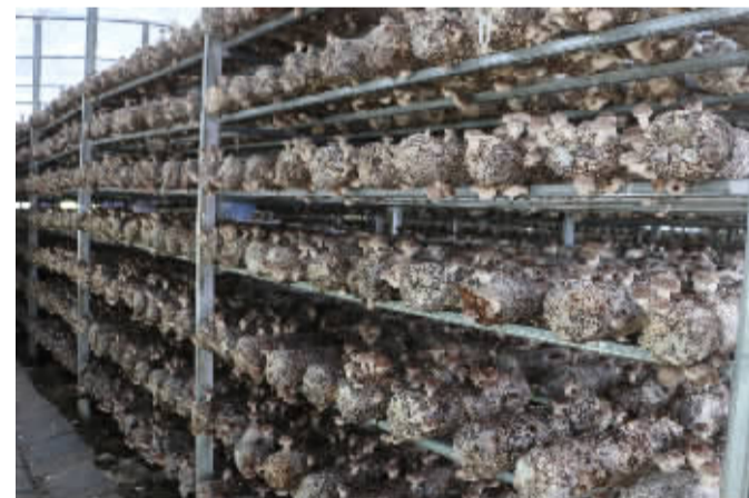
产业园区的香菇朵朵惹人爱